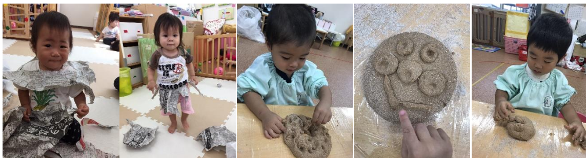
新聞遊びにふすま粉粘土! ハイハイ練習中★ 大きなショベルカーに釘付けの子ども達…