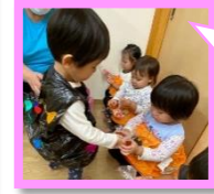
ぞう組から ドーナツの プレゼント