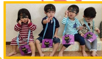
蜘蛛の巣に気を付けて！！