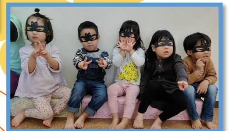
やったあ！カード見つけたよ～！