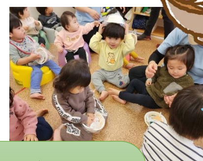
みんなでいただきま〜す！